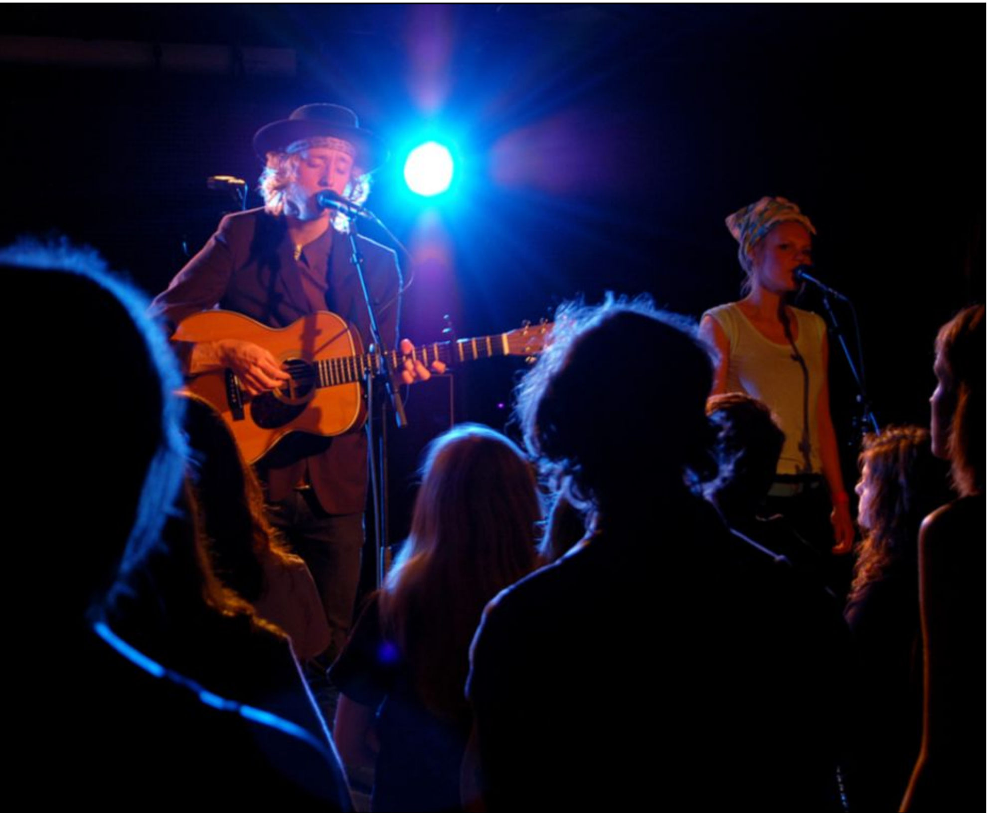
under årets Ranglerock.