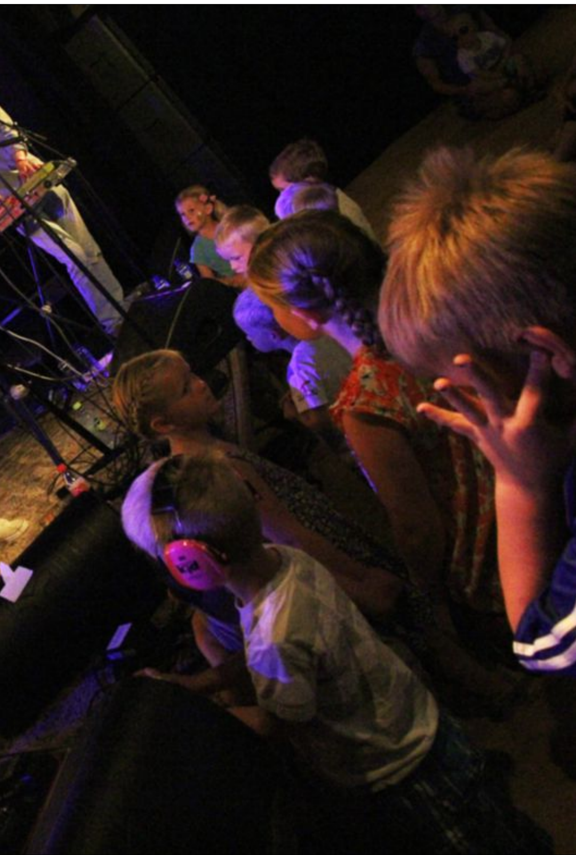
kanskje det var litt høyt.